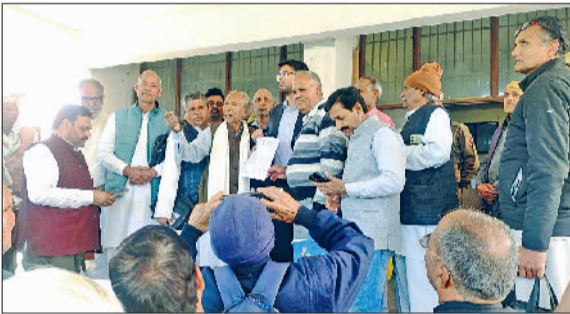
नारनौल। एसडीएम को ज्ञापन सौंपते रिटायर्ड कर्मचारी।

में कार्यरत कर्मचारियों की सुरक्षा भी प्रभावित हो रही है। यूनियन का आरोप है कि नीति लागू करने से पहले जमीनी हकीकत व कर्मचारियों की परिस्थितियों को नजरअंदाज किया गया। यूनियन ने सरकार से एनपीएस को बंद कर ओपीएस लागू करने की मांग दोहराई। वक्ताओं ने कहा कि पुरानी पेंशन योजना कर्मचारियों का वैधानिक अधिकार है।