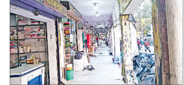
महेंद्रगढ़। व्यापारियों की ओर से खाली किए गए बरामदे।

दी है। नये आदेशानुसार दुकानदार अपनी दुकान के सामने अधिकतम दो फीट चौड़ाई और साढ़े तीन फीट लंबाई तक की एक या दो सीढ़ियां बना सकते हैं। प्रशासन ने स्पष्ट किया है कि नालियों के ऊपर केवल अस्थायी तौर पर ही सीलियां या पत्थर रखे जा सकते हैं, ताकि सफाई कर्मचारियों को नाली साफ करने में कोई बाधा न आए। इसके अलावा यह सुनिश्चित करना होगा कि इन निर्माणों से नाली का बहाव न रुके और भविष्य में सड़क निर्माण के समय इन सीढ़ियों को हटाने में दुकानदार कोई आपत्ति दर्ज नहीं करेंगे।