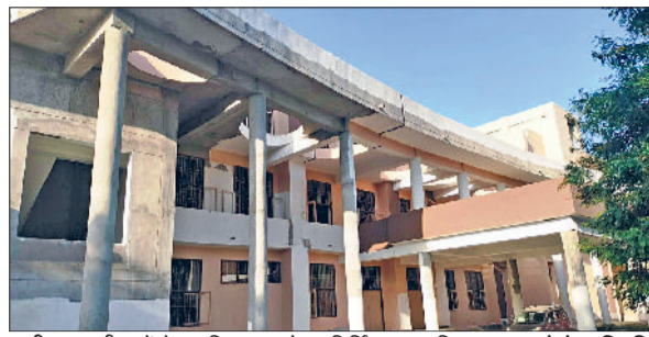
कनीना। कनीना में तैयार किए जा रहे नवनिर्मित लघु सचिवालय।

इंटीरियर कार्य के चलते व उचित रास्ता न मिलने से लटका कार्य