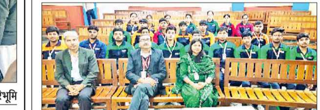
नारनौल। पारले-जी बिरिकेट फेक्ट्री का भ्रमण करते विद्यार्थी।