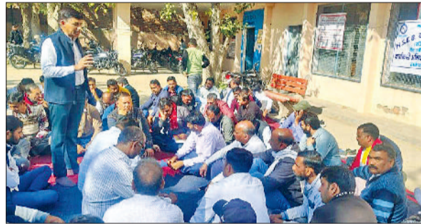
नारनौल। बैठक में कर्मचारियों को संबोधित करते यूनियन पदाधिकारी।

हरियाणा स्टेट इलेक्ट्रिसिटी बोर्ड वर्कर्स यूनियन के आह्वान पर बिजली कर्मचारियों ने अपनी लंबित मांगों को लेकर पांच दिवसीय चरणबद्ध आंदोलन की शुरुआत कर दी। आंदोलन का पहला चरण डिवीजन स्तर पर शांतिपूर्ण ढंग से आयोजित किया गया। जिसमें कर्मचारियों ने ऑनलाइन ट्रांसफर पॉलिसी का कड़ा विरोध दर्ज कराया।